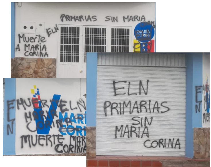
Fotografías publicadas por el partido político Vente Venezuela a través de sus redes sociales.

Aunado a lo anterior, durante el mes de julio el partido Vente Venezuela fue víctima de amenazas de muerte al equipo de trabajo y ataques directos contra la fachada del comando de campaña de la organización en el estado Táchira. Con las siglas del grupo guerrillero colombiano ELN (Ejército de Liberación Nacional) fueron marcadas las paredes de la sede de la organización con mensajes como “Primarias sin María Corina” y “muerte María Corina”